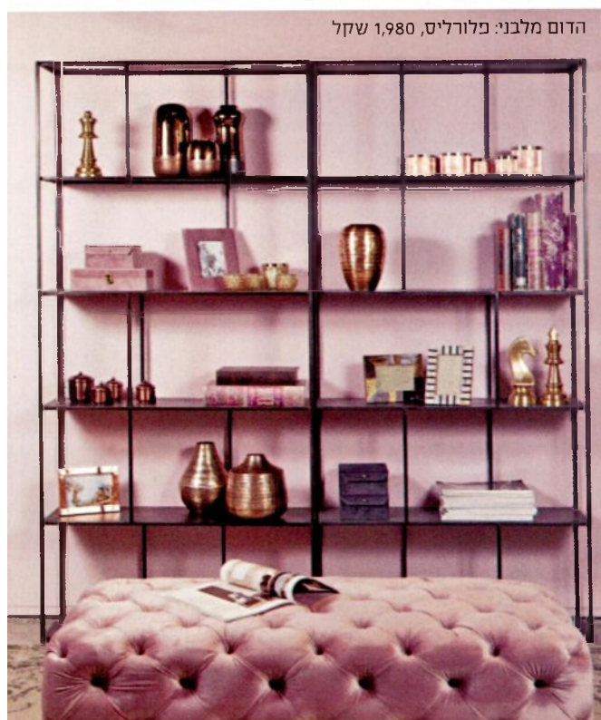
הדום מלבני: פלורליס, 1,980 שקל

בעולם העיצוב מזמן הפסיקו לפחד מהצבע הוורוד - הוא כבר לא מזוהה רק עם המין הנשי, יש לו השפעה מרגיעה וינחזה והוא מכניס לבית אלגנטיות ותחכום. הנה כל מה שאתן צריכות לדעת על שימוש נכון בצבע הכי אופטימי בפלטה | יוליה פריליקניב