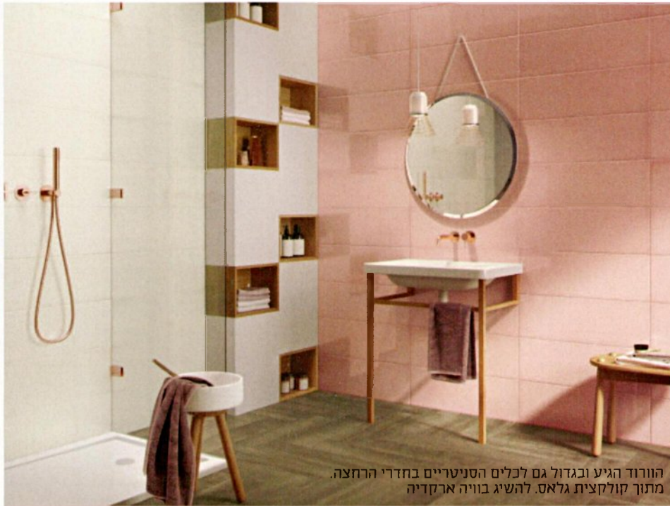
הוורוד הגיע ובגודול גם לכלים הסניטריים בחדרי הרחצה. מתוך קולקציית גלאס. להשיג בויה ארקדיה