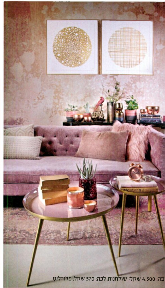
פיה: 4,500 שקל; שולחנות לכה: 570 שקל, פלורליס