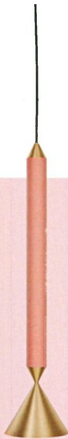
מנורה: כלי אור, 443 שקל