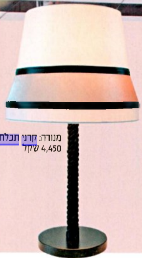
מנורה: קרני תכלת, שקל 4,450