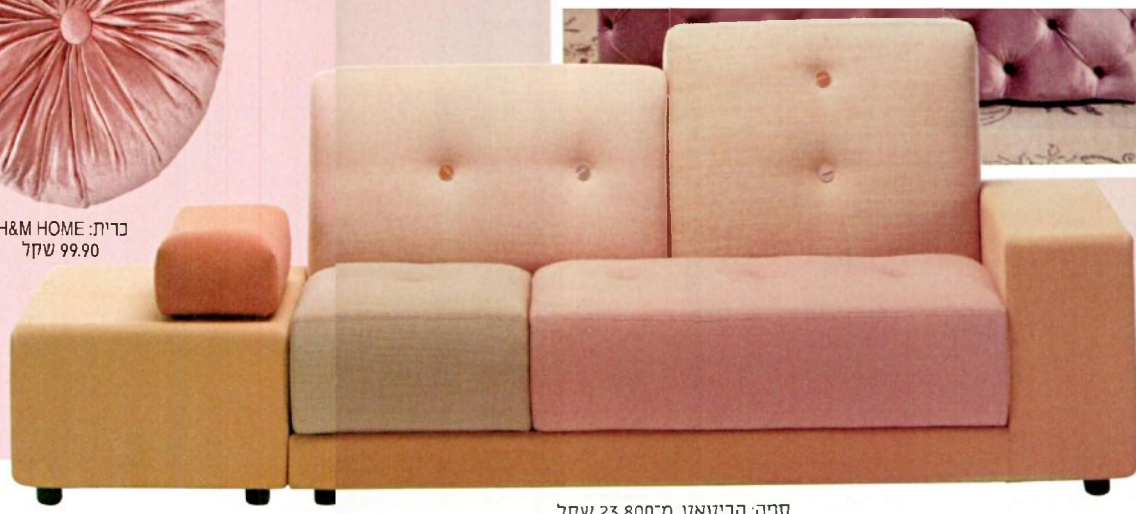
ספה: הביטאט, מ-23,800 שקל