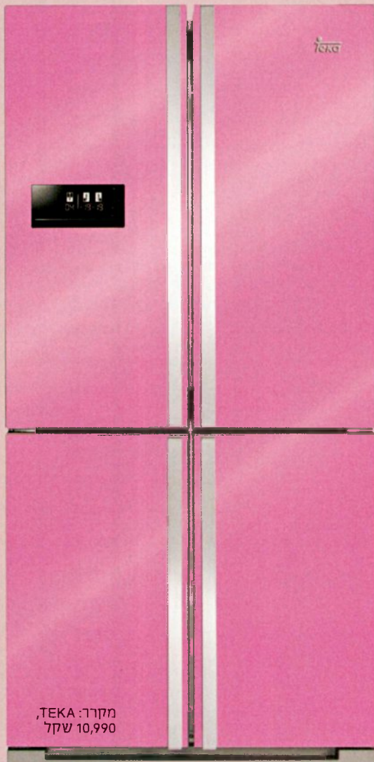
מקרר: TEKA, שקל 10,990