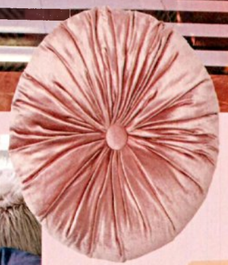
כרית: H&M HOME, שקל 99.90