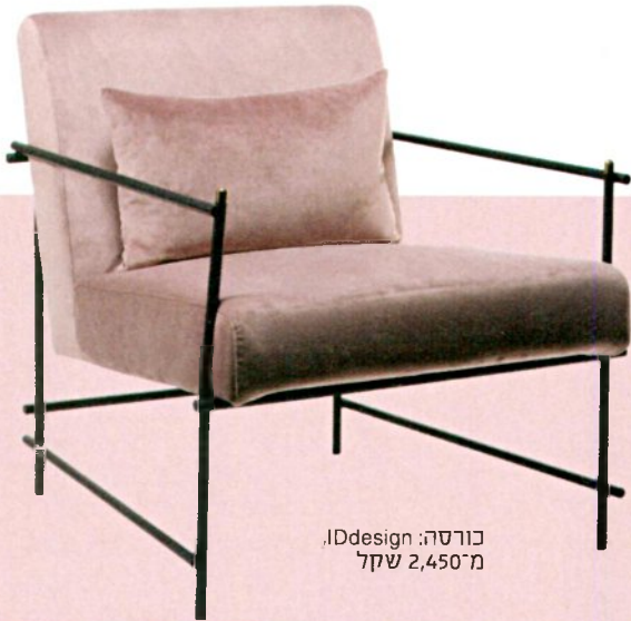
כורסה: IDdesign מ"מ 2,450 שקל