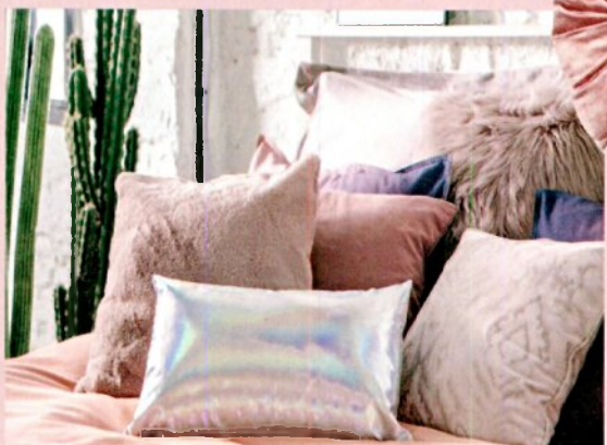
בריות: גולף & קו, מ-59 שקל לכרית