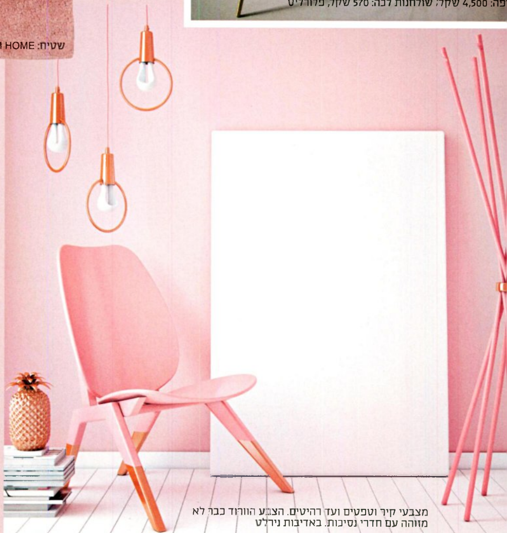
מצבעי קיר וטפטים ועד רהיטים. הצבע הוורוד כבר לא מזוהה עם חדרי נסיכות.

ולמי מתאים עיצוב ורוד ואיך תעשו זאת? "עושה רושם כי הוורוד מצוין לאנשים קלילים וצעירים ברוחם, אך מעט פתיחות תגרום לכולם להתאהב בו", אומרת מעצבת הפנים מיטל צימבר. "תתחילו עם פריטים ורודים שפשוט וקל להחליף ולשנות, כמו שטיח, אגרטל או כרית. שלבו את הוורוד עם גוונים ניטרליים וזכרו שלא צריך להפוך את הבית כולו לוורוד. לאט לאט קחו סיכון ותעזו עם ריהוט בעל נוכחות גדולה יותר, למשל גופי תאורה, טפטים, ריפודים ואפילו ארונות", מסבירה ומסכמת צימבר. ■