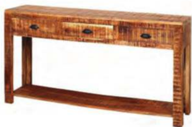
שידת מגירות עץ, נובל קולקשיון, 3,246 שקל