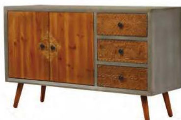
שידת מגירות אפורה, ביתילי, 2,490 שקל