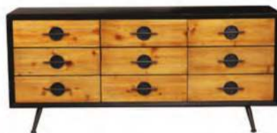
שידת מגירות שחורה, ביתלי, 3,350 שקל