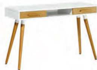
קונסולה, רשת Urban, 890 שקל